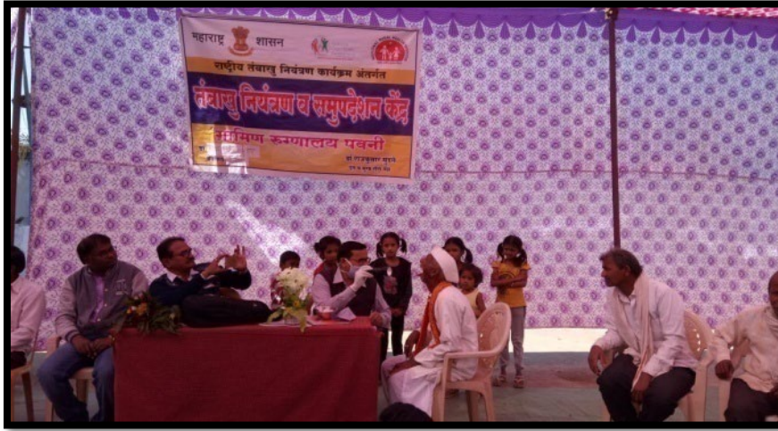
Dental Check up and Tobacco Eradication Camp 09/01/2019