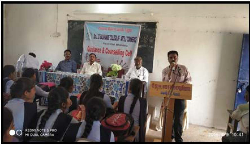
Seminar on Psychological Disorders 09/04/2019